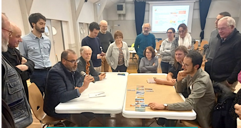
Le 16/11 à Saint-Uniac