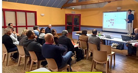
Le 14/11 à Monterfil